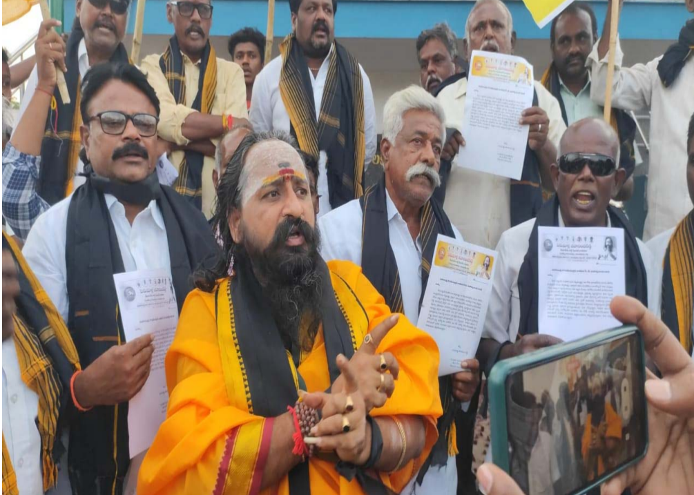
అయిపోయిందన్నారు. తెలుగుదేశం పార్టీ అధినేత నారా చంద్రబాబు నాయుడు గారి అక్రమారెస్టుపై ప్రజలు నిరసనలు తెలియజేస్తుంటే 144 సెక్షన్ అమలులోకి తెచ్చి, ప్రజల గొంతు నొక్కే ప్రయత్నం చేస్తున్న జగన్ రెడ్డి బ్రిటిష్ పాలన ని తలపిస్తుందన్నారు. భారత రాజ్యాంగం మానవ హక్కులు ని కాలరాస్తున్నారన్నారు. ప్రభుత్వ వ్యవస్థలను తన సొంత కక్షలకు ప్రతికరాలకు ఉపయోగించి ప్రజలను ప్రజా శ్రేయస్సు రాష్ట్ర అభివృద్ధి పూర్తిగా గాలికి వదిలేసి సీఎం జగన్ సైకో విధానాన్ని నిరూపిస్తూ ప్రజల పక్షాన గొంతు విప్పే నాయకులు మీద అక్రమ కేసులని భోజనం