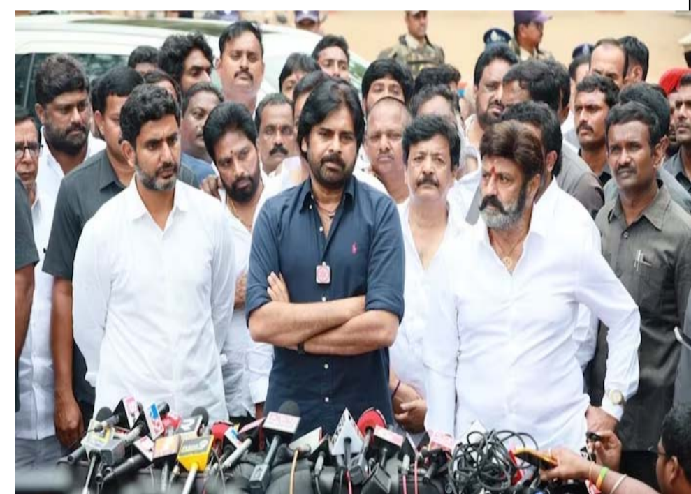
జర్నలిస్టు మిత్రులు అడగాలని పవన్ కళ్యాణ్ కాదని.. సాక్షి యజమానిని కూడా సూచించారు. ఎంతసేపు చంద్రబాబు, పవన్ ప్రశ్నించాలని ఎద్దేవా చేశారు. ఏపీలో ఆరాచక పాలన

నిజంగా జగన్ యుద్ధమే కోరుకుంటే తాము సిద్ధం జగన్ కుదముంటే ఒక ప్రెస్ మీట్ పెట్టాలి పవన్ కళ్యాణ్ డిమాండ్ ఏపీ సీఎం జగన్ పై జనసేన అధినేత పవన్ కళ్యాణ్ తీవ్రస్థాయిలో ఆరోపణలు చేశారు. ఏపీలో యుద్ధ వాతావరణం క్రియేట్ చేయాలని జగన్ భావిస్తున్నాడని.. నిజంగా జగన్ యుద్ధమే కోరుకుంటే తాము సిద్ధంగా ఉన్నామని పవన్ కళ్యాణ్ స్పష్టం చేశారు. మాజీ సీఎం చంద్రబాబును అరెస్ట్ చేసిన విధానం, తనను తెలంగాణ బోర్డర్ లో అడ్డుకున్న విధానం ప్రజాస్వామ్యానికి వ్యతిరేకమని.. పోలీసులను అడ్డం పెట్టుకుని జగన్ సీచ రాజకీయాలకు పాల్పడుతున్నాడని నిజంగా జగన్ యుద్ధమే కోరుకుంటే తాము సిద్ధంగా ని పవన్ ఆరోపించారు. అటు గత నాలుగున్నరేళ్లలో జగన్ ఒక్క ప్రెస్ మీట్ కూడా పెట్టలేదని.. దమ్ముంటే ఒక ప్రెస్ మీట్ పెట్టాలని సాక్షి మీడియా సహా