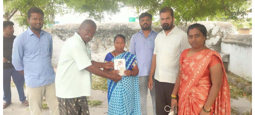
గుత్తి (ప్రజా తపన) సెప్టెంబర్ 12 :