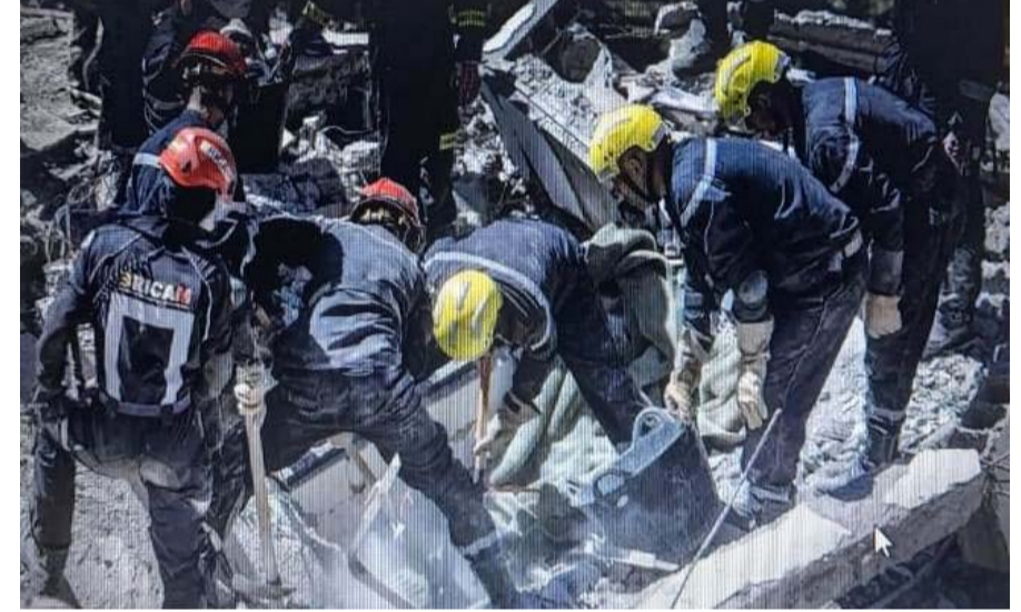
మొర్రాకో సెప్టెంబర్ 12

మొర్రాకో లోని అట్లాస్ పర్వతాల్లో 6.8 తీవ్రతతో సంభవించిన భారీ భూకంపం ఎంతటి చెమటాన్ని మిగిల్చిందో ప్రత్యేకించి విప్పనవసరం లేదు. భూకంపం ధాటికి కుప్పకూలిన భవన శిథిలాలను తొలగిస్తున్న కొద్ది కుప్పలుగా శవాల బయటపడుతున్నాయి. ఈ శక్తివంతమైన భూకంపం ధాటికి మరణించిన వారి సంఖ్య అంతకంతకూ పెరుగుతోంది. తాజాగా మృతుల సంఖ్య 3,000 చేరువైంది. స్థానిక అధికారులు వెల్లడించిన వివరాల ప్రకారం.. మృతుల సంఖ్య 2,862కు చేరింది. ఇక ఈ వివత్తుకు 2,500 మందికిపైగా తీవ్రంగా గాయపడ్డారు. వారిలో కొందరి పరిస్థితి విషమంగా ఉంది. ప్రస్తుతం అక్కడ సహాయక చర్యలు కొనసాగుతున్నాయి. సుమారు 100 మంది మొర్రాకో రక్షణ బృందం సహాయక చర్యల్లో పాల్గొంటోంది. భూకంపం వచ్చి ఇప్పటికే 72 గంటలకు పైనే అయిపోయింది. దీంతో ప్రభావిత ప్రాంతాల్లో శిథిలాల కింద చిక్కుకున్న బాధితుల సజీవంగా బయటకు వస్తారన్న ఆశలు క్రమంగా సన్నగిల్లుతున్నాయి. భూకంపం కేంద్ర ప్రాంతమైన అట్లాస్ పర్వత ప్రాంతంలోని మారుమూల గ్రామాల్లో పరిస్థితి దయనీయంగా