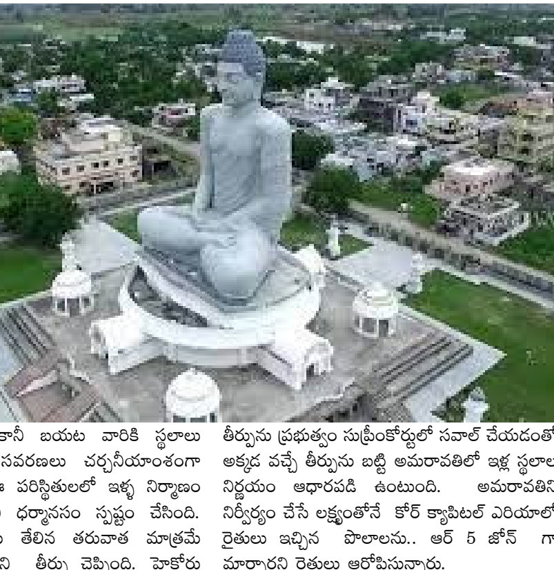
కేటాయించారని... కానీ బయట వారికి స్థలాలు ఇస్తామని తెచ్చిన సవరణలు చర్చనీయాంశంగా ఉన్నాయన్నారు. ఈ పరిస్థితులలో ఇళ్ల నిర్మాణం అనుమతించ లేమని ధర్మాసనం స్పష్టం చేసింది. సుప్రీం లో కేసులు తేలివ తరువాత మాత్రమే నిర్మాణాలు చేపట్టాలని తీర్పు చెప్పింది. హైకోర్టు తీర్పును ప్రభుత్వం సుప్రీంకోర్టులో సవాల్ చేయడంతో అక్కడ వచ్చే తీర్పును బట్టి అమరావతిలో ఇళ్ల స్థలాల నిర్ణయం ఆధారపడి ఉంటుంది. అమరావతిని నిర్దిష్టం చేసే లక్ష్యంతోనే కోర్ట్ క్యాపిటల్ ఎరియాలో రైతులు ఇచ్చిన పొలాలను... ఆర్ 5 జోన్ గా మార్చారని రైతులు ఆరోపిస్తున్నారు.

అవకాశం లేదు. హైకోర్టు ధర్మాసనం ఇచ్చిన తీర్పులో కీలక అంశాలు ఉన్నాయి. అమరావతి ఆర్ 5 జోన్ లో చేపట్టే ఇళ్ల నిర్మాణాలను వెంటనే నిలిపివేయాలని ఏపీ ప్రభుత్వాన్ని హైకోర్టు ఆదేశించింది. సుప్రీం ఉత్తర్వుల ప్రకారం పేదలకు ఇస్తున్న పట్టాలు అతిమ తీర్పునకు లోబడి ఉంటాయని హైకోర్టు ధర్మాసనం గుర్తు చేసింది. స్థలం ఇవ్వడానికి మాత్రమే అనుమతి గానీ కట్టడానికి కాదని స్పష్టం చేసింది. అదే సమయంలో ప్రభుత్వం తామే నిర్ణయించిన భూమి విలువ రూ. 345 కోట్లు సీఆర్డీయే కు చెల్లించలేదని హైకోర్టు ధర్మాసనం మరో కారణంగా తెలిపింది. మూడో కారణంగా మొత్తం ఖర్చు 1500 - 2000 కోట్లు ... స్థలాలు/ ఇల్లు... తీర్పు వ్యతిరేకంగా వస్తే ఎవరు దీనికి భాద్యత ? వహిస్తారని ప్రశ్నించింది. ప్రజల సొమ్ము దుర్వినియోగం చేస్తుంటే కోర్టు చూస్తూ ఉరుకోదని స్పష్టం చేసింది. అమరావతి తీర్పు లో కూడా ఆప్పటి వరకు చేసిన ఖర్చు వుదా అవుతుందని కోర్టు చెప్పిందని ధర్మాసనం తెలిపింది. సీఆర్డీయే నిబంధనల ప్రకారం భూమి కోల్పోయిన వారికి హాసింగ్ కోసం 5 శాతం భూమి