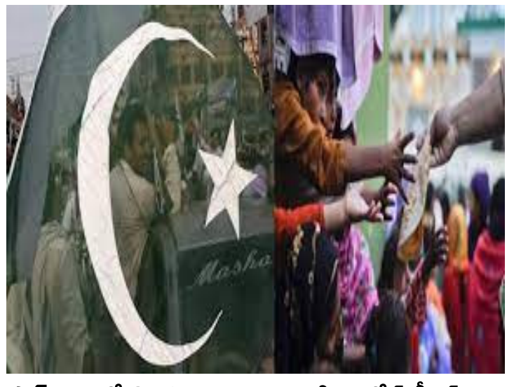
పాక్ చరిత్రలో తొలిసారి రూ.300 దాటిన పెట్రోల్, డీజిల్ ధరలు