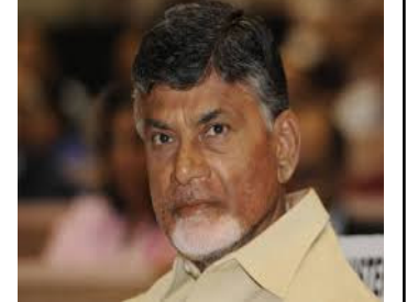
చంద్రబాబు కు ఆదాయపన్ను శాఖ షోకాజ్ నోటీసులు