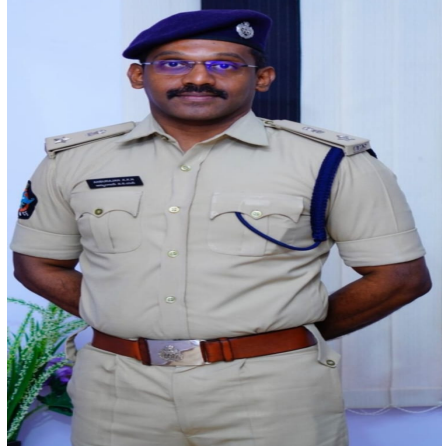
చేయడం జరిగిందన్నారు. అవాస్తవాల ప్రచారం చేసేవారిపై లీగల్ ఓపీనియన్ తీసుకుని చట్టప్రకారం చర్యలు తీసుకుంటామని ఆయన హెచ్చరించారు.