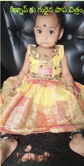
కిడ్నాప్ కు గురైన పాప పిల్ల