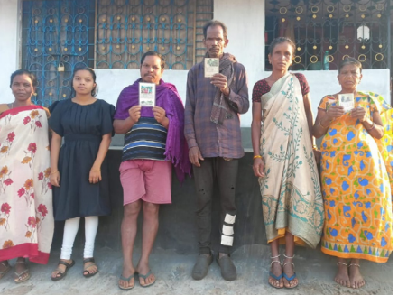
నిలిపివేయడంతో ఇబ్బందులు ఎదుర్కొంటున్నాయని తెలిపారు. తమకు ఇంతలా ఇబ్బందులకు గురి చేయడం ఎంతవరకు సమంజ సమని ప్రశ్నించారు. సంబంధిత అధికారులకు తెలియజేసిన పట్టింపుకోవడం లేదని వాపోతున్నారు. పంచాయతీ వీఆర్డో ను వివరణ కోరగా నా దృష్టికి ఎప్పుడు రాలేదని అర్హత కలిగిన ప్రతి ఒక్కరికీ రేషన్ సరుకులు అందేలా చర్యలు తీసుకుంటామని చెప్పారు. ఇప్పటికైనా ఉన్నత అధికారులు స్పందించి రేషన్ బియ్యం అందేలా చర్యలు తీసుకోవాలని గిరిజనులు వేడుకొంటున్నారు.

మండలంలోని శిరగం పంచాయతీ కోడిపుంజు వలస గ్రామానికి చెందిన ఐదు గిరిజన కుటుంబాలు సుమారు మూడు సంవత్సరాలుగా రేషన్ సరుకులు అందక నానా అవస్థలు పడుతున్నారు ఈ సందర్భంగా వారు మాట్లాడుతూ మూడు సంవత్సరాలు గా రేషన్ సరుకులు నిలిపి వేయడంతో అర్థాకలితో వస్తులు ఉంటున్నాయని ఉపాధి కూలీ లేక పిల్ల పాపలతో అలమటిస్తున్నాయని వాపోయారు. అర్హత కలిగిన ప్రతి ఒక్కరికీ రేషన్ సరుకులు ఇస్తున్నామని ప్రభుత్వం చెబుతున్న కేవలం అవి ప్రచారం వరకే పరిమితమని గిరిజనల అరోపిస్తున్నారు. తమకు ఎలాంటి ప్రయోజనం లేదని గిరిజనులు ఆందోళన చెందుతున్నారు. రేషన్ కార్డులు ఉన్నాయని అయితే ప్రభుత్వం జారీ చేసిన రైస్ కార్డులు రాకపోవడంతో రేషన్ బియ్యాన్ని మధ్యలోనే నిలిపివేశారన్నారు. గతంలో రేషన్ సరుకులు ఇచ్చేవారని ఇప్పుడు ఇతరాలే కారణాలు చూపి రేషన్ బియ్యాన్ని