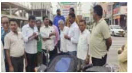
యని, దీనివల్ల అనేక రోడ్డు ప్రమాదాలు జరుగుతూ ప్రజలు ప్రాణాలు కోల్పోతున్నారని ఆవేదన వ్యక్తం చేశారు. ప్రమాదాల్లో మరణించిన వారిలో పోలీసు శాఖకు చెందిన మహిళా ఏఎస్ఐ కూడా ఉండటం విచారకరమని వాపోయారు. అదగకుండానే జిల్లా ప్రకటించిన ముఖ్యమంత్రి కేసీఆర్, బైపాస్ రోడ్డు నిర్మాణంపై కరుణ చూపాల ని కోరారు. బైపాస్ రోడ్డు నిర్మాణానికి సాంకేతిక కారణాలు ఎదురయినట్లుంటే, పెద్దపల్లి పట్టణం నుండి ఓవర్ బ్రిడ్జి ఏర్పాటు చేయాలని అదేవిధంగా పరిపాలనా సౌలభ్యం కోసం పెద్దపల్లి అర్బన్, రూరల్ మండలాలను ఏర్పాటు చేయాలని విన్నవించారు. ఈ కార్యక్రమంలో పలువురు పాల్గొన్నారు.