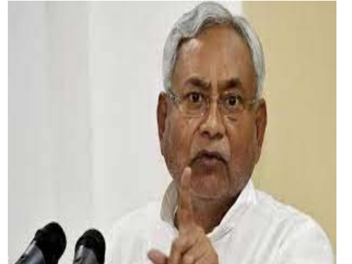
ప్రతిపక్షాల సమావేశం జరుగుతుందని చెప్పారు. ప్రతిపక్షాల మధ్య ఐక్యత పెరుగుతుండటంతో బీజేపీకి భయం పట్టుకుందన్నారు. ఏప్రిల్-మే నెలల్లో సార్వత్రిక ఎన్నికలు జరిగితే తనకు నష్టం జరగవచ్చునని బీజేపీ భయపడుతోందన్నారు. అందుకే ముందస్తు ఎన్నికలు రావచ్చునని అంచనా వేస్తున్నట్లు తెలిపారు. బిహార్లో ప్రభుత్వాన్ని ఏర్పాటు

సార్వత్రిక ఎన్నికలను ఎదుర్కొనడానికి భారతీయ జనతా పార్టీ భయపడుతోందని బిహార్ ముఖ్యమంత్రి, జేడీయూ చీఫ్ నితీశ్ కుమార్ అన్నారు. అదే సమయంలో హిందుస్థాన్ అవామ్ మోర్చా-సెక్యులర్ వ్యవస్థాపకుడు జీతన్ రామ్ మార్ఖి పై తీవ్ర ఆరోపణలు చేశారు. బిహార్ అధికార కూటమి మహాకూటమి పార్టీలపై ఆయన బీజేపీ తరపున గూఢచర్యం చేస్తున్నారని ఆరోపించారు. హెచ్ఎంఎంఎస్ను జేడీయూలో విలీనం చేయడానికి ఇష్టపడటం లేదు కాబట్టి ఆ పార్టీ ఇకపై మహాకూటమిలో భాగంగా ఉండబోదని చెప్పారు. నితీశ్ కుమార్ శుక్రవారం విలేజ్ కల్ల సమావేశంలో మాట్లాడుతూ, ఈ నెల 23న