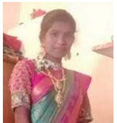
ప్రారంభించిన పోలీసులు ఆదివారం పోస్టుమార్టం నిర్వహించి మృతదేహాన్ని బంధువులకు అప్పగించారు. అయితే సోమవారం బంధువులు అంత్యక్రియలు నిర్వహించేందుకు ఏర్పాట్లు చేసుకోగా పోలీసులు వెళ్లి నిలిపివేశారు. అనంతరం