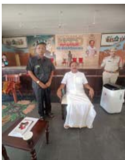
తెలిపారు. ఈ సంస్థకు అవసరమైన మేరకు వ్యవస్థాగత నిర్మాణపరమైన సహాయ సహకారాలు ఎల్లవేళల అందిస్తానని భరోసా ఇచ్చారు.