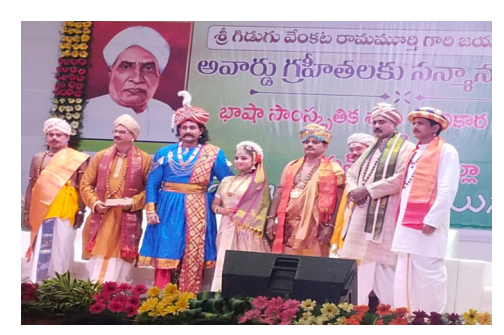
తుమ్మలపల్లి కళాక్షేత్రంలో ఈరోజు ప్రధానం చేశారు. వేదిక మీద అనేక సాంస్కృతిక కార్యక్రమాల్ని నిర్వహించారు