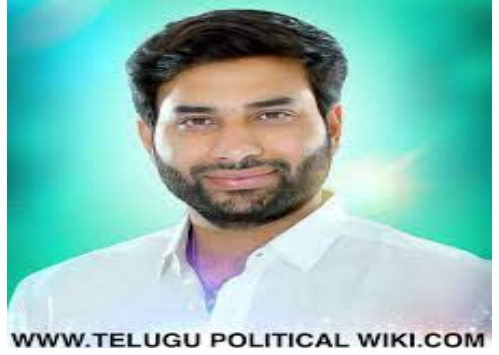
www.telugu political wiki.com