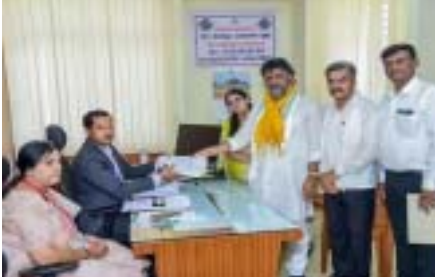
అత్యధికంగా బీజేపీ తరపున 707 నామినేషన్లు చేశారు. కాంగ్రెస్ తరపున 651 మంది, జేడీఎస్ తరపున 455, ఆమ్ 373, బీఎస్పీ 179, ఎన్సీపీ 5 మంది, సీపీఎం 5 నామినేషన్లు దాఖలయ్యాయి. రిజిస్టర్ అయి ప్రాధాన్యత రాజకీయ పార్టీల నుంచి 1007 మంది నామినేషన్లు వేయగా, స్వతంత్రులుగా 1720 మంది వేశారు. మొత్తం 5102 నామినేషన్లు దాఖలయ్యాయి. కనకపూర్ నియోజకవర్గం నుంచి కేపీసీసీ ఢిఫ్ డి కే శివకుమార్ నామినేషన్ దాఖలు చేసారు.

కర్ణాటకలో ఎన్నికల వాతావరణం వేడెక్కింది. గురువారం నామినేషన్లు ముగిసింది. 224 నియోజకవర్గాలకుగాను 3,632 మంది అభ్యర్థులు 5,102 నామినేషన్లు దాఖలు చేశారు. గడిచిన ఎన్నికలతో పోలిస్తే రికార్డు స్థాయిలో నామినేషన్లు దాఖలైనట్లు తెలుస్తోంది. గురువారంతో నామినేషన్లు ముగిశాయి. చివరిరోజు 1619 మంది 1934 నామినేషన్లు దాఖలు చేశారు. వీరిలో 1544 మంది పురుషులు 1771 నామినేషన్లు చేశారు. 146 మంది మహిళలు 162 నామినేషన్లు దాఖలు చేశారు. ఇతరులు ఒక నామినేషన్ దాఖలు చేశారు. 224 నియోజకవర్గాలకు 3,632 మంది 5102 నామినేషన్లు చేశారు. వీరిలో 3327 మంది పురుషులు 4710 నామినేషన్లు దాఖలు చేశారు. 304 మంది మహిళలు 391 నామినేషన్లు చేశారు.